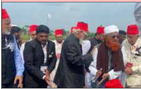
Prominent delegates at the foundation stone laying ceremony of AIMJF Degree college at Dhar Road, Parbhani