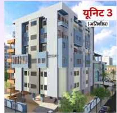
यूनिट 3 (अतिशीघ्र)