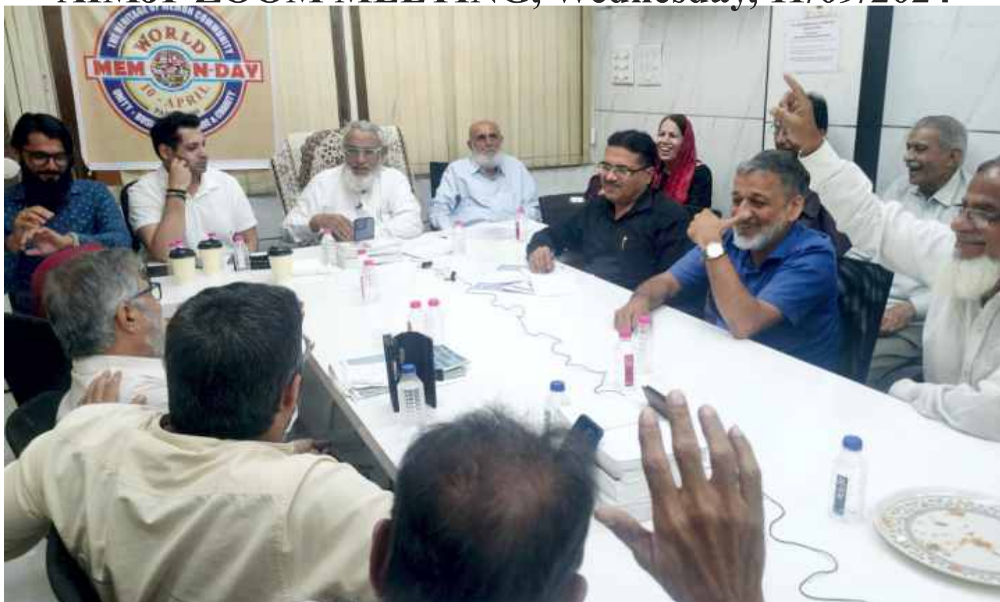
Local members of AIMJF gathered at the AIMJF Office in Beg Mohammed Park for a Zoom meeting, with hundreds joining online to discuss the forthcoming AGM and Memon Convention.

Zoom Meeting of All India Memon Jamat Federation was held on Wednesday, 11/09/2024 from 7.30 pm to 10.00 pm in which Board Members, Zonal Secretaries, NEC Members, Jamat Delegates & Guests were present.