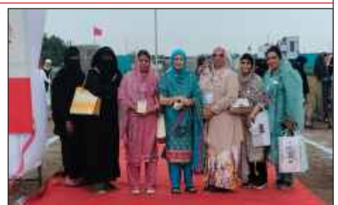
Ladies of AIMJF & Parbhani Jamat representatives at the foundation stone laying ceremony of AIMJF Degree College