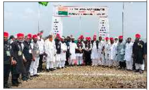
Large number of delegations around India attended the foundation stone laying ceremony