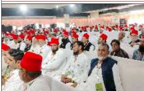
Jamat representatives from all around India & members of AIMJF graced the AGM cum Memon Convention held on 22nd Sep 2024 at Parbhani