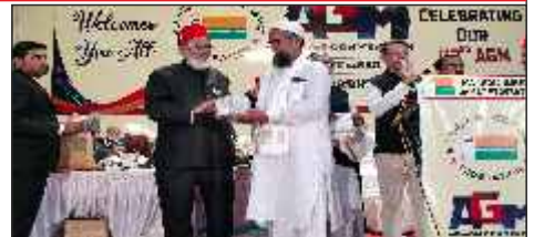
Mr President presenting momentum