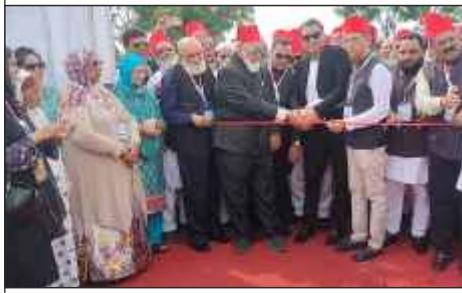
Inaugurating the venue of the AIMJF Degree college by the auspicious hands