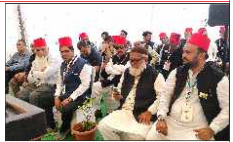
Prominent delegates at the Venue of foundation stone laying ceremony of AIMJF Degree college.