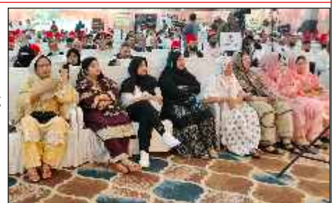
Lady members of All India Memon Jamat Federation & prominent personalities attending the AGM cum Memon Convention held on 22nd Sep 2024 at Parbhani