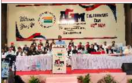
Member of Parliament Honorable Shri Sanjay Jadhav addressing the AGM cum Memon Convention held on 22nd Sep 2024 at Parbhani