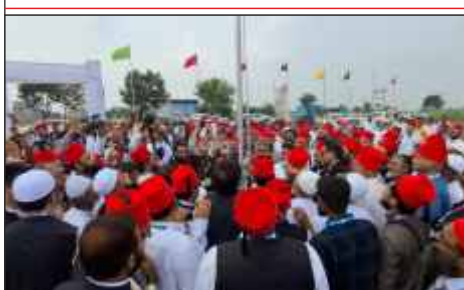
Hoisting of AIMJF Flag at the location of Foundation stone laying ceremony of AIMJF Degree College