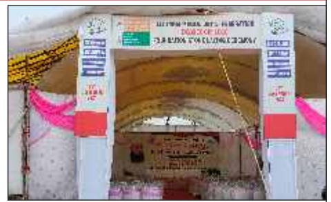
Venue of AIMJF Degree College, Firdous Colony, Dhar Road, Parbhani. Foundation stone laying ceremony held