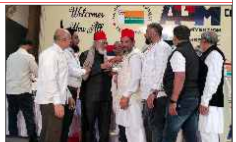
Team of Saurashtra Memon Jamats felicitating Mr President of AIMJF at Parbhani.