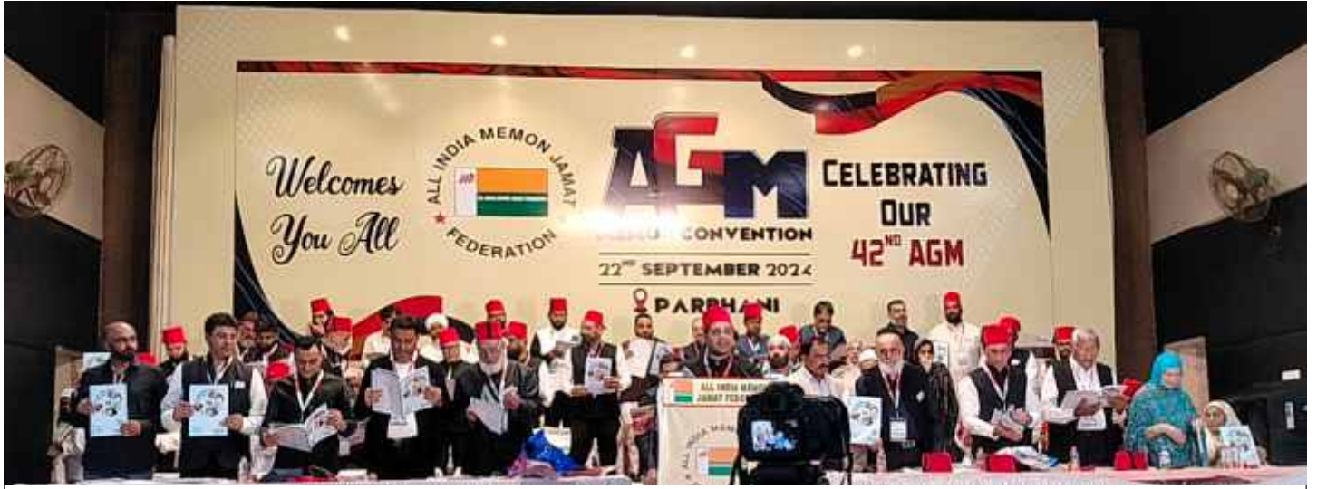
Inauguration of AIMJF Annual Report at AIMJF Annual General Meeting cum Memon Convention held on 22nd Sep, 2024 at Parbhani.