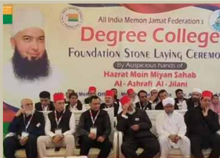
Foundation stone laying ceremony of All India Memon Jamat Federation (AIMJF) first ever Degree college held on 22nd September at Firdous Colony, Dhar Road, Parbhani.