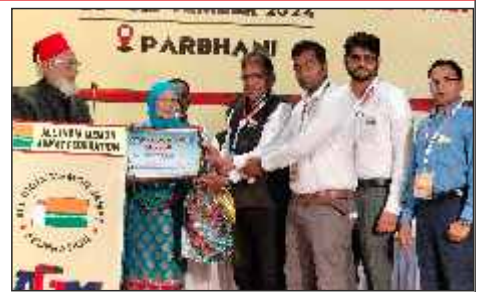
BEST School award to AIMJF Jalgaon school awarded by CM of Maharashtra, presented to Mr President of AIMJF by Jalgon School team members at Parbhani.