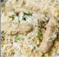
Malai Seekh Biryani

Ingredients for Seekh: 1 small onion | Some mint and coriander leaves | 2 green chillies | 500 gms boneless chicken (cut in cubes) | Salt to taste | 1 tsp red chilli flakes | 1tbsp ground and roasted coriander seeds and cumin | 1 tsp ginger garlic paste | 2 tsp roasted gram powder | 1