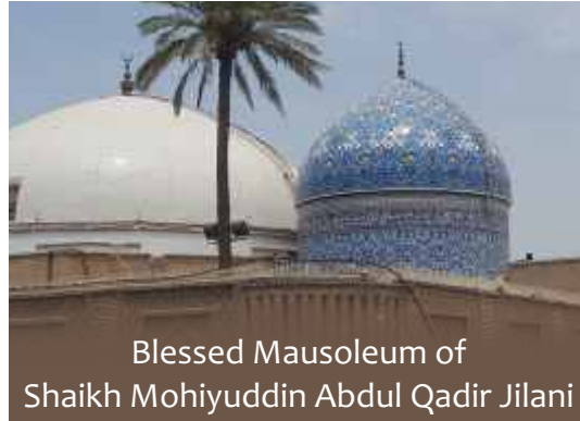
Blessed Mausoleum of Shaikh Mohiyuddin Abdul Qadir Jilani

benefit and avoiding any harm; and you should not move yourself in your own interest and not rely on yourself in matters concerning yourself and not protect yourself nor help yourself, but leave the whole thing entirely to God; because He had the charge of it in the beginning and so will He have it till the end, just as the charge rested on Him when you were hidden in the womb (of your mother) as also when you were being suckled as a baby in the cradle.