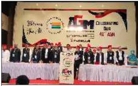
Members and guests standing for National Anthem followed by AIMJF Anthem at AGM cum Memon Convention held on 22nd Sep 2024 at Parbhani