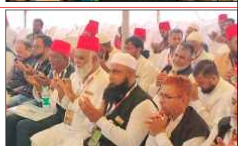
Dua -E- Khair for the AIMJF Degree College at Firdous Colony, Dhar Road, Parbhani