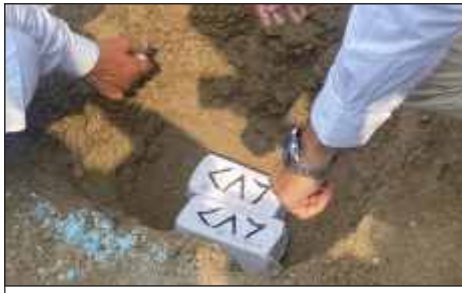
Foundation Stone of All India Memon Jamat Federation's First Degree College in Parbhani.