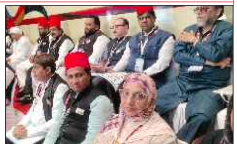
Board members at dais at the AGM cum Memon Convention held on 22nd Sep 2024 at Parbhani