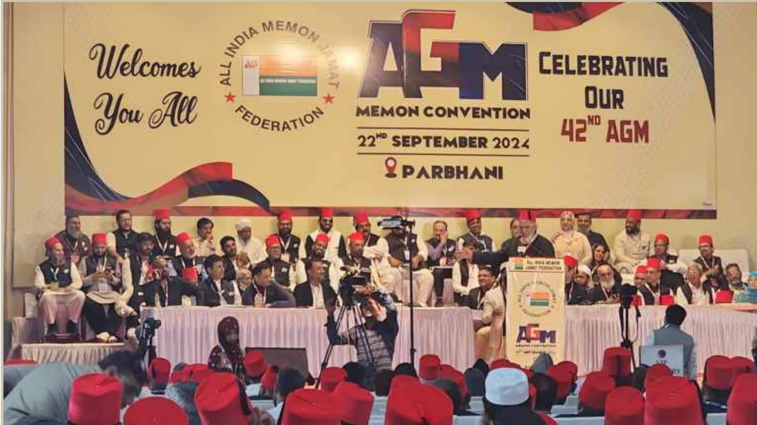
42nd Annual General Meeting (AGM) cum Memon Convention of All India Memon Jamat Federation (AIMJF) held on 22nd September 2024, Parbhani Maharashtra. Large number of AIMJF Board members, NEC members, Zonal Secretaries, Jamat representatives, Local jamat members and well-wishers graced the function and made this event a grand success.

Leading News Magazine of Memon Community Largely Circulated All over India & Abroad.