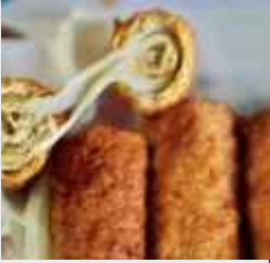
Chicken Shahi Roll

For Chicken Filling: Chicken (boneless): 300 g (cut into thin strips) | Yogurt: 2 tbsp | Ginger-Garlic Paste 1 tbsp | Turmeric powder: ¼ tsp | Red chili powder: