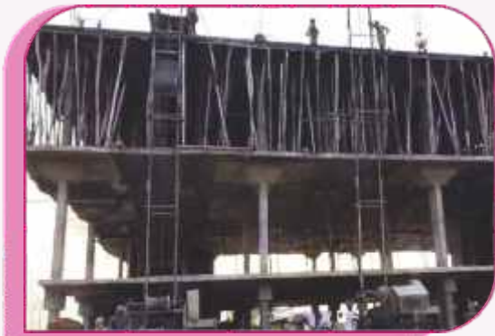
NEW UNIT UPCOMING IN JAGDALPUR