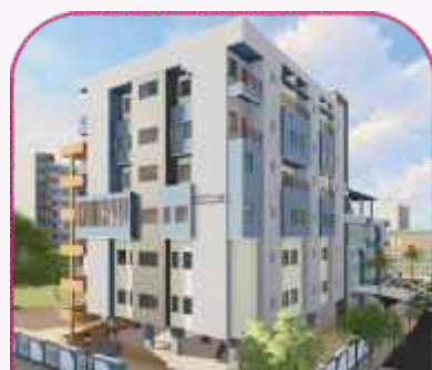
Unit - 3

25+ DOCTORS, 350+ STAFF, 180 BEDS, 18 YEARS OF EXPERIENCE