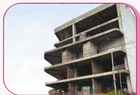
NEW UNIT UPCOMING IN BILASPUR